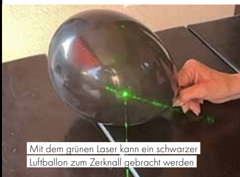
Mit dem grünen Laser kann ein schwarzer Luftballon zum Zerknall gebracht werden

Erklärung. Der Zerknall erfolgt aus den gleichen Gründen, wie das Entzünden beim beschriebenen Zündholz- und Papierversuch (siehe oben). Experimente haben gezeigt, dass schwarze Luftballons wesentlich besser und schneller zum Zerplatzen gebracht werden, als andersfarbige (Begründung wie gehabt!).