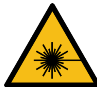
Gefahrenpiktogramm für Laserstrahlung gemäß ÖNORM EN ISO 7010.