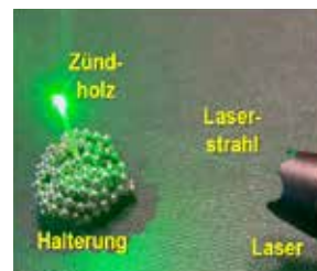
Entzündung eines Streichholzes

Erklärung. Der energiereiche und fokussierte Laserstrahl überträgt die notwendige Aktivierungsenergie auf das Zündholz bzw. das Pyro-Papier. Dabei wird die erforderliche Zündtemperatur durch Energieübertragung nach wenigen Sekunden erreicht, wodurch es zur Entflammung der Materialien kommt. Anmerkung: Weißes Pyro-Papier ist wesentlich schlechter zu entzünden als schwarzes Pyro-Papier, weil letzteres die durch den Laser übertragene Lichtenergie besser absorbiert.