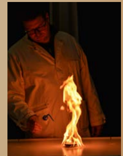
... schwimmt das Benzin auf und kann nicht gelöscht werden