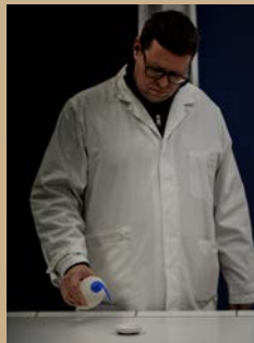
... von Wasser erlischt die Flamme