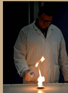
Benzinbrand: Durch die Beigabe von Wasser...